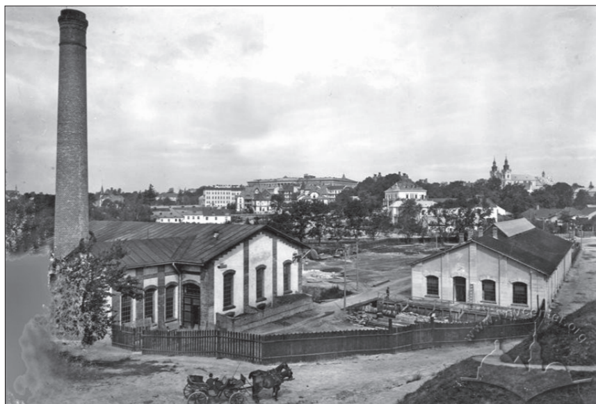
Pierwsza elektrownia we Lwowie