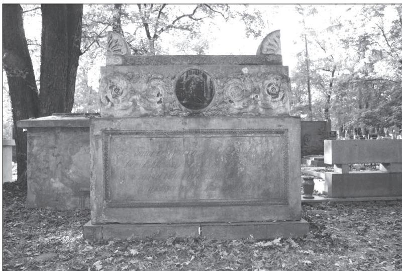
Grobowiec Stanisława Tomickiego na Cmentarzu Rakowickim w Krakowie, zostali w nim pochorowani także jego rodzice