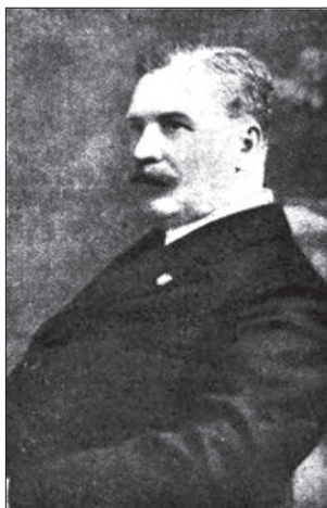
Józef Tomicki (1863–1925)

za którą to został na rok uwięziony w Cytadeli. Po uzyskaniu dyplomu inżyniera w 1891 roku, kontynuował przez rok naukę na Uniwersytecie w Bonn, gdzie studiował filozofię 4 .