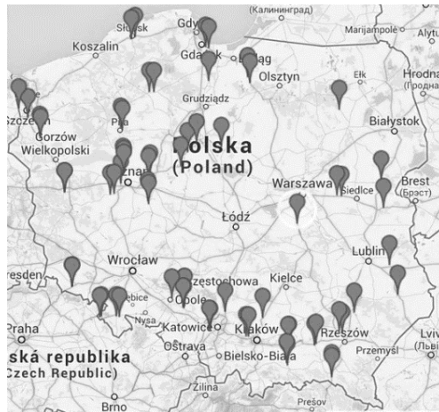
Rysunek 3. Istniejące lokalizacje systemów preselekcyjnego ważenia pojazdów w ruchu

Od początku 2012 roku tylko na drogach Generalnej Dyrekcji Dróg Krajowych i Autostrad powstało 101 punktów ważenia pojazdów w ruchu. Na rysunku 3 zaprezentowano mapę z lokalizacjami istniejących systemów preselekcyjnych.