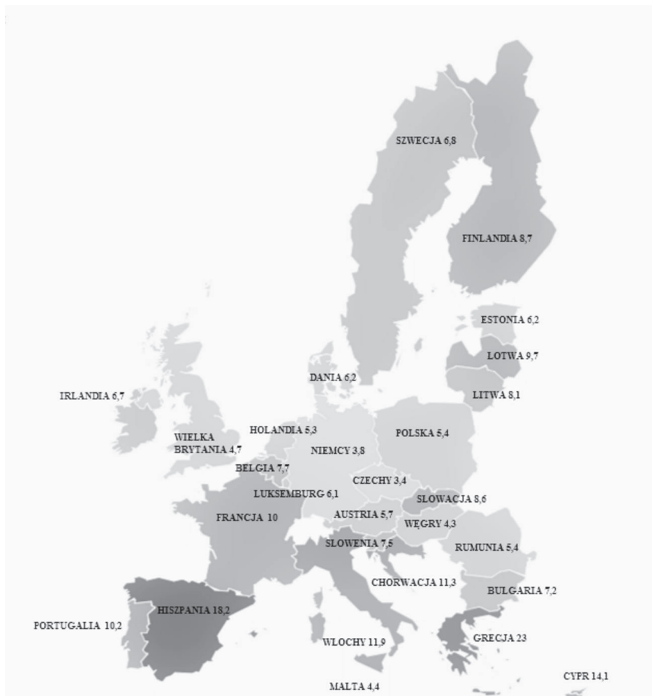
Rysunek 2. Stopa bezrobocia w Unii Europejskiej w 2017 roku