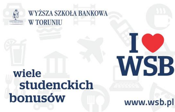
Rysunek 2. Wzór karty rabatowej WSB w Toruniu

Konkurencyjna uczelnia w tym samym mieście – Wyższa Szkoła Bankowa, ma w swojej ofercie również kartę rabatową (rys. 2) dla studentów. Program rabatowy „Wiele studenckich bonusów” to projekt, który ma uatrakcyjnić życie studenckie w mieście. Z rabatów oferowanych przez partnerów tej inicjatywy mogą korzystać studenci oraz pracownicy uczelni. Informacje o tym, gdzie odebrać kartę oraz kto jest partnerem i co oferuje, można odnaleźć na stronie internetowej uczelni. Partnerzy karty są z różnych branż i jest ich ok. 30.