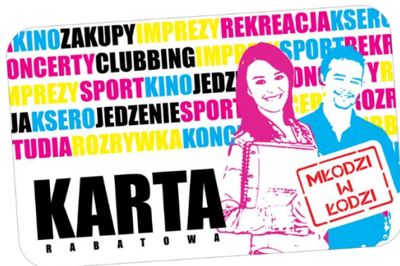
Rysunek 3. Wzór karty Młodzi w Łodzi

wydarzeń na uczelniach, szkoleniach i kursach organizowanych dla studentów, profilaktycznych badaniach itd.