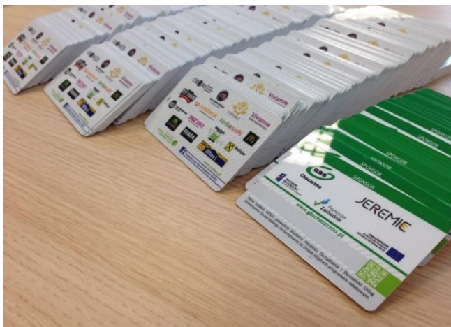
Rysunek 4. Karta WZiEU

W roku akademickim 2014–2015 na Wydziale Zarządzania i Ekonomiki Usług powstała karta rabatowa dla studentów Wydziału (rys. 4).