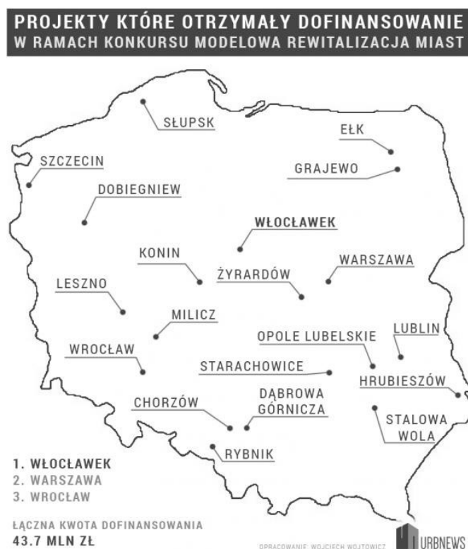
Rysunek 1. Miasta, w których projekty otrzymały dofinansowanie