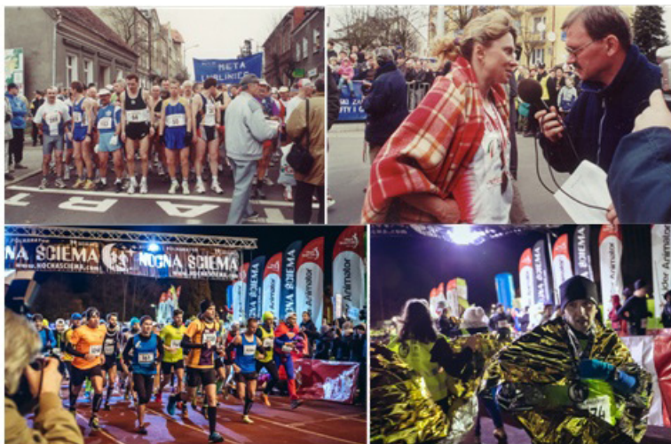
Rysunek 2. Organizacja biegów w latach 2001 (Maraton Dębno) i 2016 (Nocna Ściema – Koszalin)