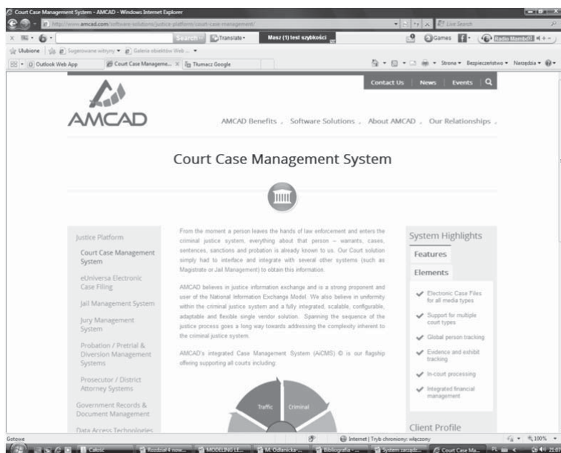
Rys. 2. Printscreen strony oferującej oprogramowanie w zakresie CMS