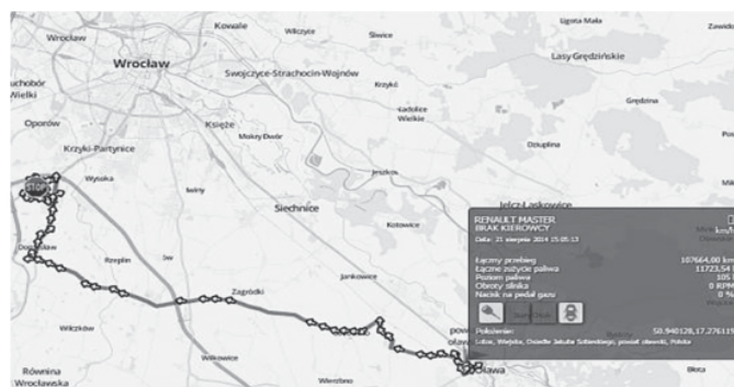
Rys. 2. Monitoring GPS programu ActiveGPS

W zakresie kontroli floty pojazdów do często wykorzystywanych systemów należy ActiveGPS, jest to zestaw narzędzi pozwalający na kontrolę i zarządzanie flotą pojazdów dzięki zainstalowaniu na ich pokładzie odbiorników GPS, sond paliwowych oraz innych czujników. Na rysunku 2 przedstawiono okno dialogowe monitoringu w programie ActiveGPS pozwalającym na śledzenie położenia i stanu pojazdu zobrazowane na interaktywnej mapie.